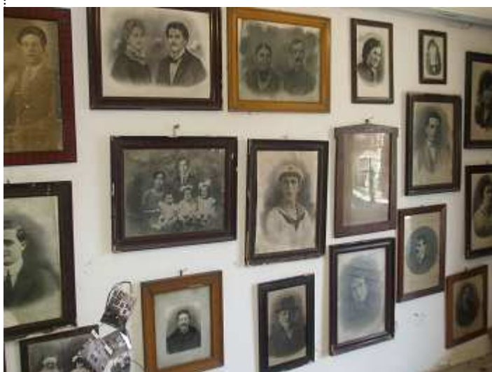
Volti senza nomi