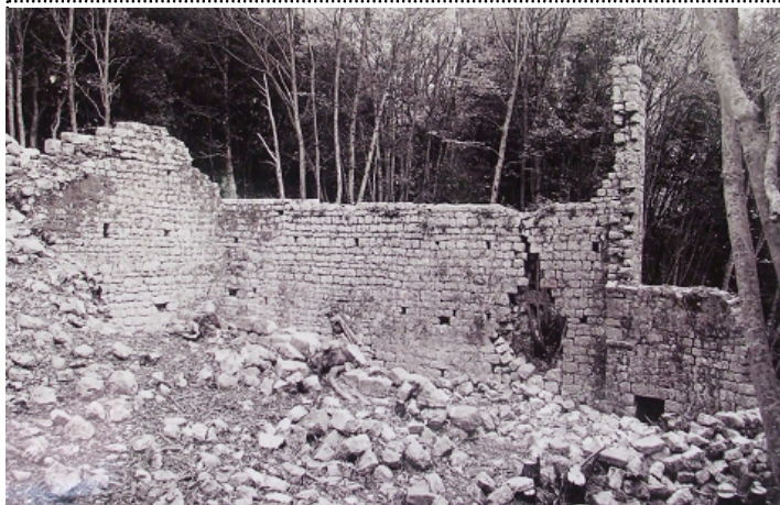
Resti della chiesetta sulle pendici del monte Ossero

chiesa chiesetta diroccata che si trovava (e si trova tuttora) nei loro possedimenti tra la collina di Halmaz ed il monte Ossero, chiesetta costruita presumibilmente nel XI secolo da dei monaci eremiti dell'Ordine Benedettino dei Camaldolesi, per riconsacrarla e dedicarla al culto di S. Maria Maddalena, a cui asserivano essa fosse originariamente dedicata.