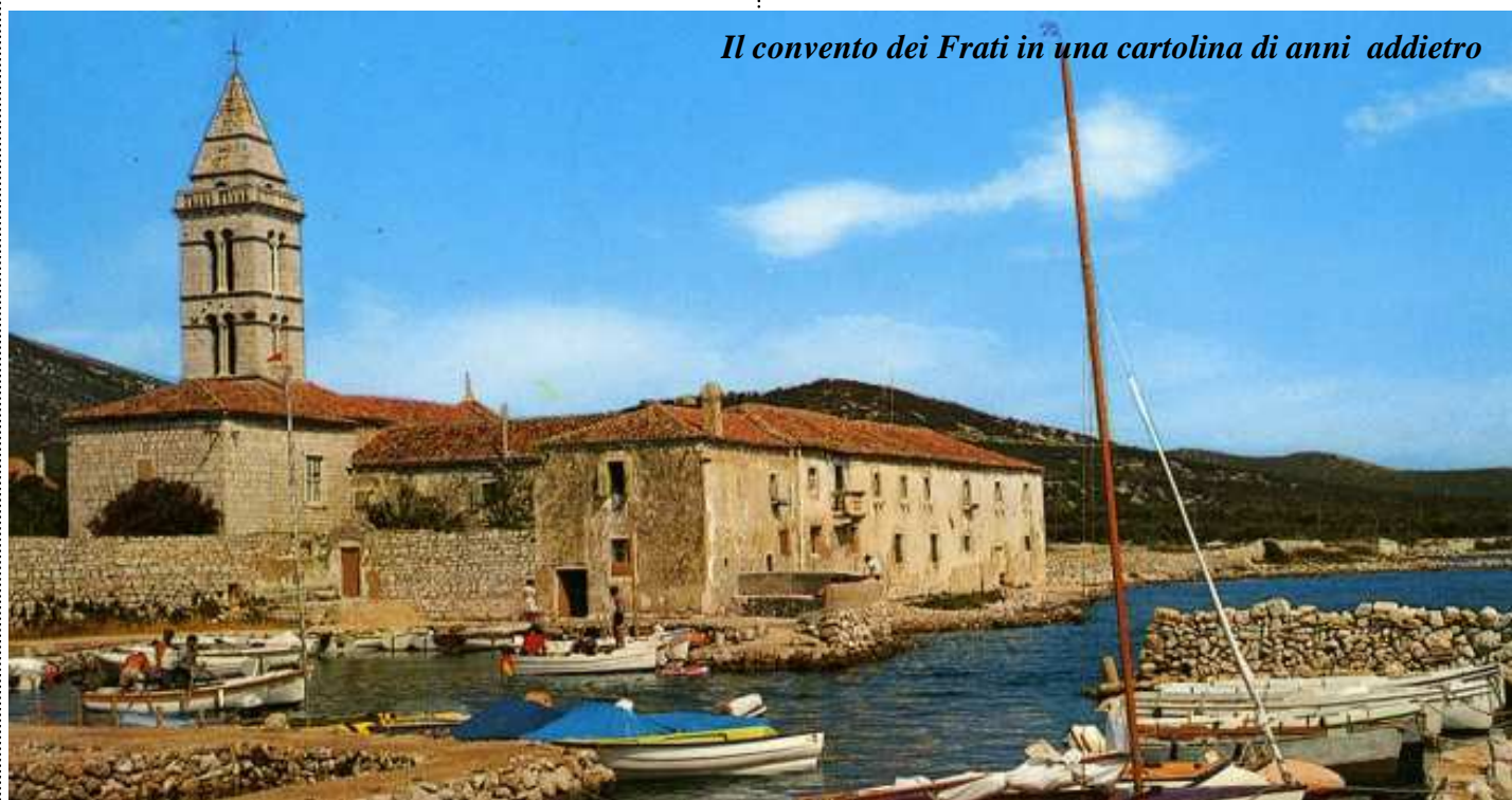
Il convento dei Frati in una cartolina di anni addietro

A Neresine i nuovi frati si misero subito all'opera cercando di sostituire nella liturgia della Chiesa la lingua latina e italiana con il serbocroato, è stato addirittura fatto un tentativo di introdurre la lingua veteroslava denominata "glagolito" nella celebrazione della Messa domenicale. Questa operazione è stata respinta dalla maggioranza della popolazione con moti popolari e altre manifestazioni di forte opposizione. A seguito di queste azioni politiche è venuta a crearsi, per la prima volta in paese, una forte divisione tra compaesani: tra abitanti di "sentimenti italiani" (circa 85%) e abitanti di "sentimenti croati" (circa 15%) come si diceva allora. Prima l'omogeneità etnico culturale era totale ed assoluta, esisteva una sola lingua ufficiale scritta ed era l'italiano, mentre la lingua madre parlata da tutta la popolazione in famiglia era quel dialetto slavo, di cui tutti noi abbiamo chiara memoria. Non a caso in tutti gli altri piccoli paesi dell'arcipelago Quarnerino: Sansego, Unie, Ciunski, Belei, Ustrine, S. Giovanni, S. Martino di Cherso, Orlez, pur avendo come lingua ufficiale l'italiano e come lingua madre il dialetto slavo, ma non avendo sollecitazioni politiche nazionalistiche dalle istituzioni, come quelle messe in atto dai frati di Neresine, non hanno sofferto di alcuna divisione politica, e ciò anche dopo l'esodo, la loro omogeneità etnico-culturale è rimasta inalterata fino ai giorni nostri. (Non sono stati menzionati i paesini