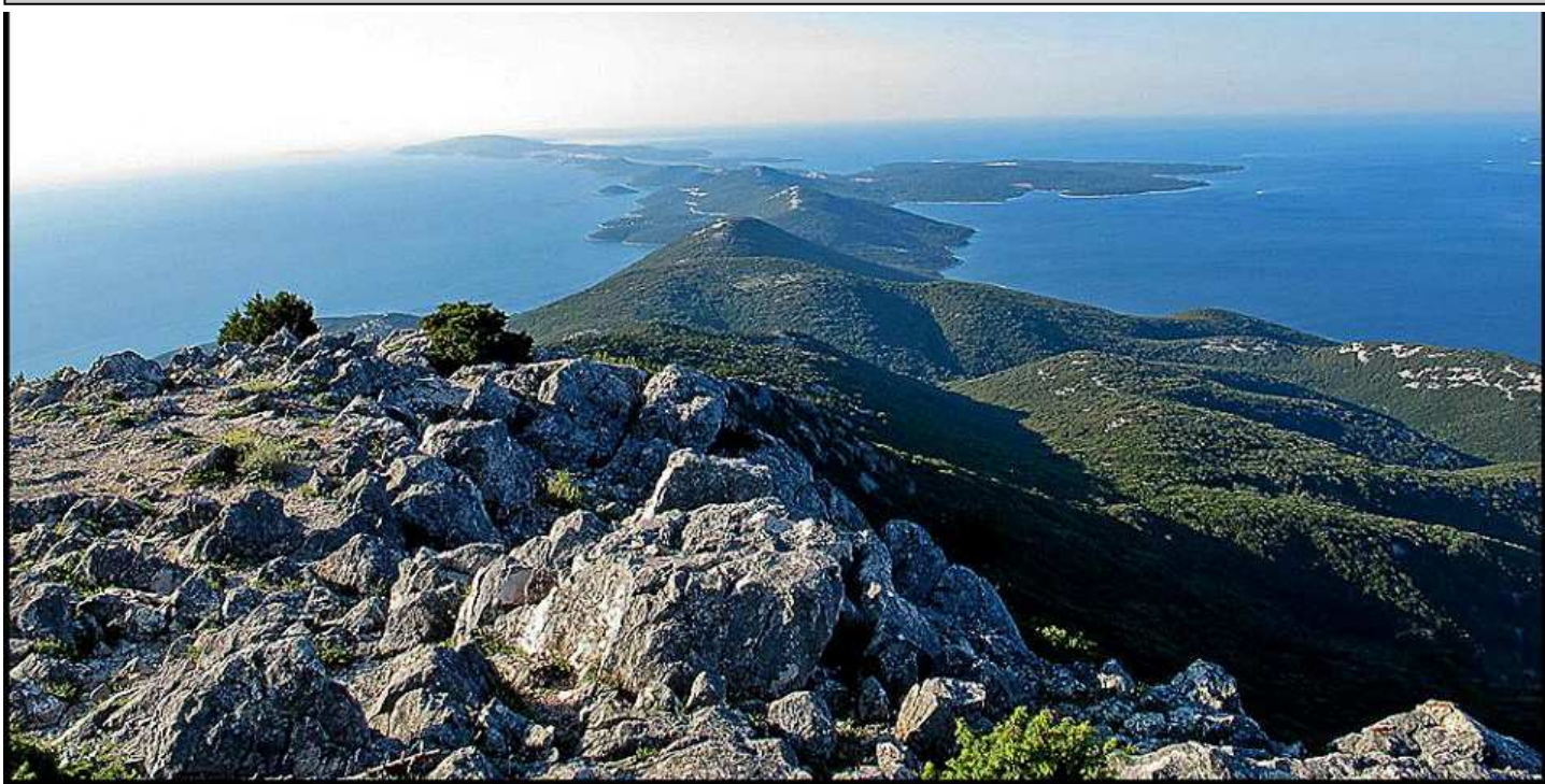
Una splendida veduta dalla cima del monte Oszero verso Lussino