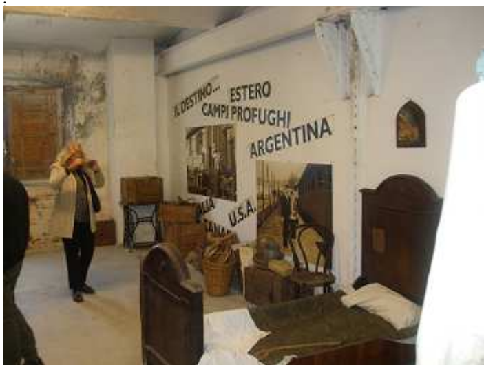
La stanza che ricorda l'emigrazione all'estero