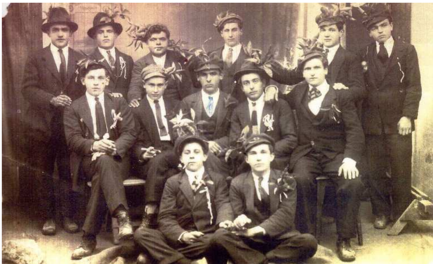
Coscritti neresinotti classe 1903

zio militare nell'allora Reggimento di Fanteria Dalmata posizionato nel Veneto; (da questi aneddoti sono nati anche alcuni soprannomi di famiglia di Neresine: Zanetic'evi e Katuric'evi).