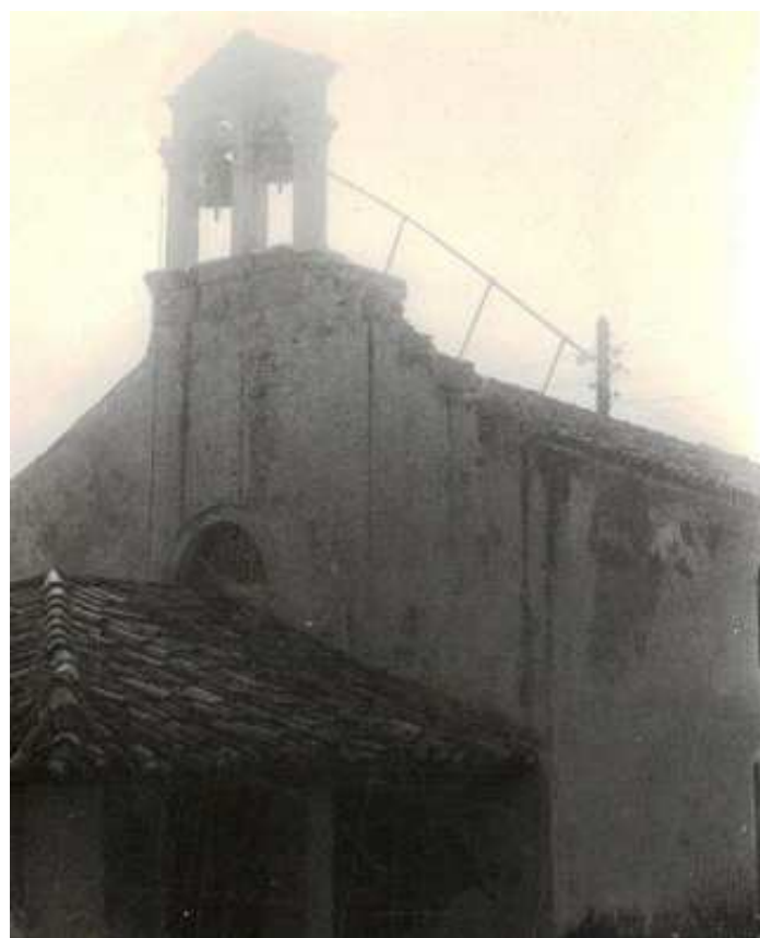
Vecchia foto della chiesetta di S.Maria Maddalena

Sconfitti i Turchi e liberata Belgrado, le armate cri-