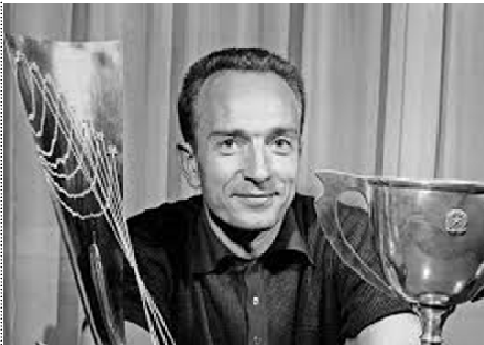
Foto giovanile di Abdon Pamich