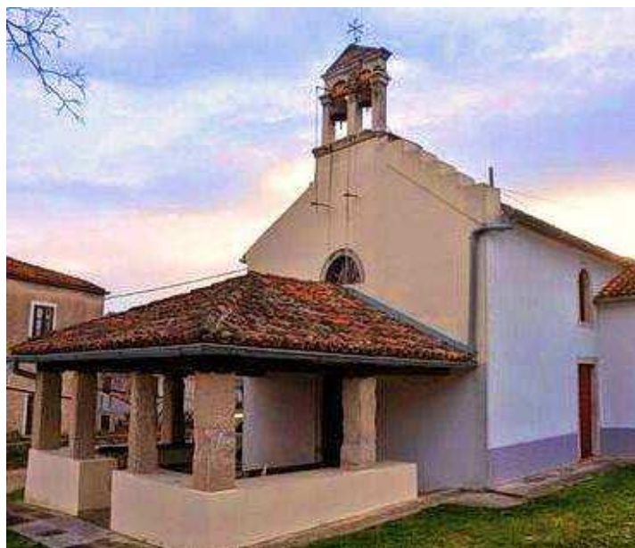
S. Maria Maddalena oggi

Come già detto, a quel tempo gran parte del territorio dove stava sorgendo il paese di Neresine apparteneva