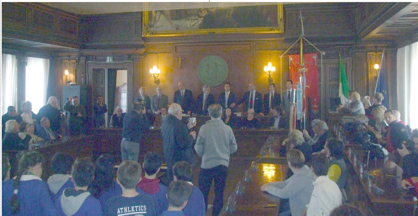
All'interno della sala consiliare