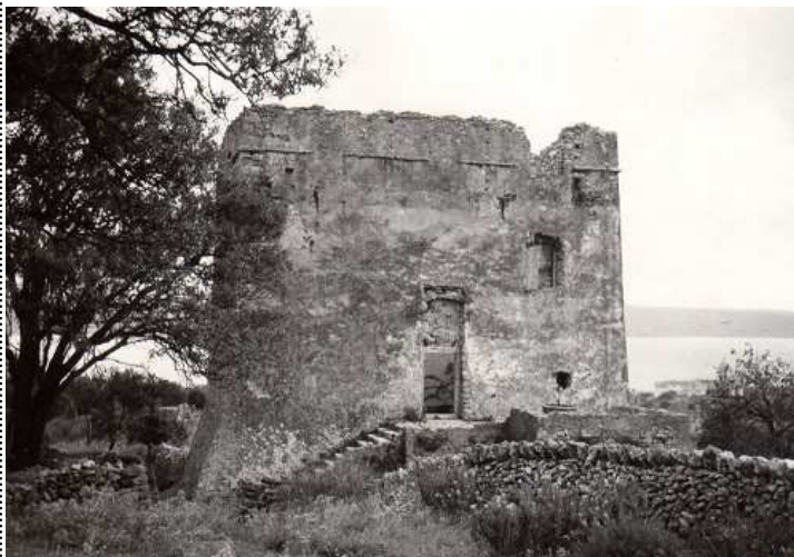
Il "Castello di Neresine" come si vede oggi