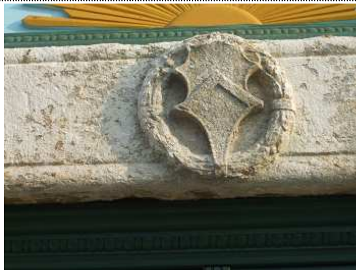
Lo stemma della famiglia Drasa sull'architrave della chiesa dei Frati a Neresine