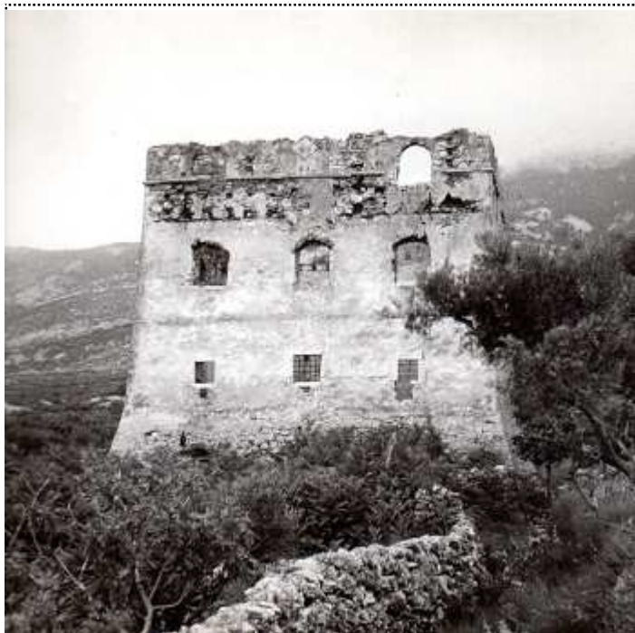
Il "Castello di Neresine" in un'immagine più recente