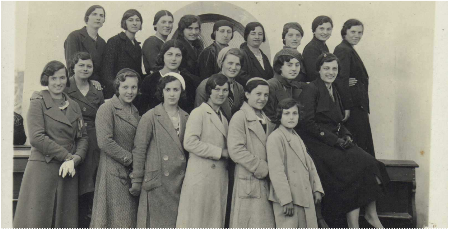
Signore e signorine neresinotte anni '30