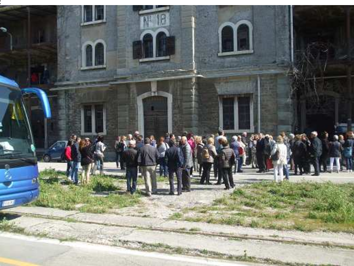
La comitiva davanti al magazzino 18

a base di pesce. Terminato di pranzare, il gruppo si è recato nel vicino museo dell'IRCI nelle cui sale al pian terreno era allestita una mostra commemorativa su Nazario Sauro in occasione della ricorrenza dei cento anni dal suo sacrificio. Alle 17, dopo un'altra passeggiata ad itinerario libero, tutti i componenti della numerosa comitiva sono saliti nei due pullman per il ritorno a Mestre. Unanime da parte di tutti l'apprezzamento per la bella gita e il proposito di ripeterne un'altra in altro luogo. Sia il Piccolo di Trieste che il Gazzettino di Venezia hanno dedicato, con foto, un servizio all'avvenimento. F.A.