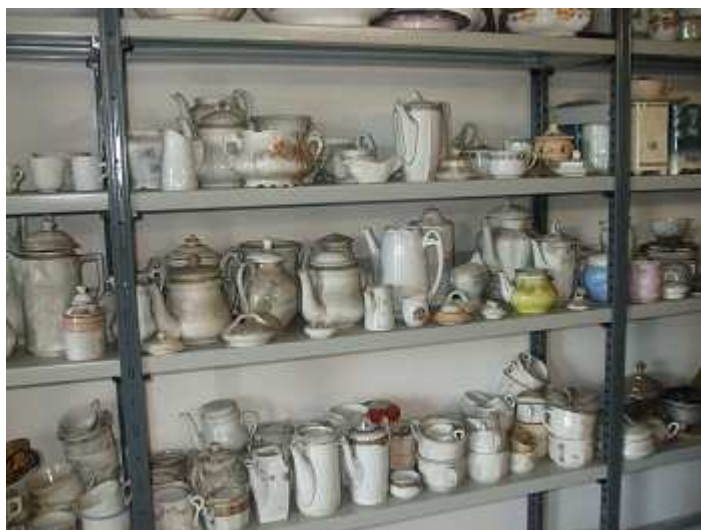
Le innumerevoli stoviglie depositate